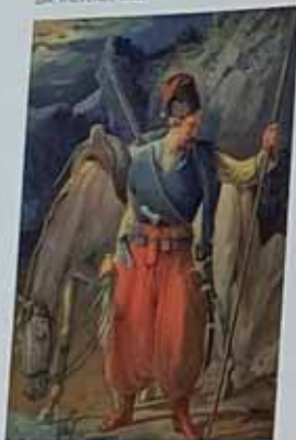
Запорозьць у XVIII ст. Котко В. Хімія з акварелі французького художника В. Шарбона. I половина XIX ст. Назва: "ЗАПОРІЗЬКИЙ КОЗАК У XVIII ВІСІ". Повторення: 30 x 42 см. ДПР, № 4252420, 3-525.