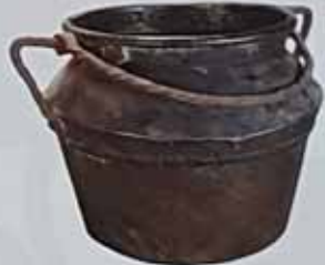
Казан. XVIII ст. Кришківський район. Мідь, покриття, аплікація, вишарпана, аплікація. Н: 28,5 см, D: 18 см. ДП. П/В-476, К/1-5421.