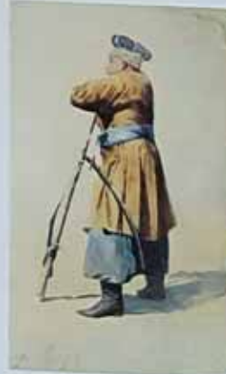
Варшавський козак. С. І. Васильківський (1854 - 1917). 1890 - 1900-4 рр. Папір, акварель: 26,6 x 15,3 см. СОХР, № Г. 940.