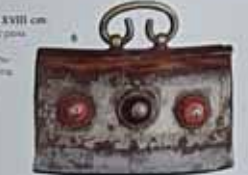
Кришка. XVIII ст. м. Кришків. Значення на 0-000 грн. м. Дніпропетровська, на території колишньої Гетьманщини.