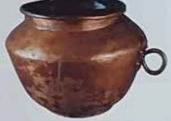
Казан. XVII ст. Кришківський район. Мідь, покриття, аплікація, вишарпана, аплікація. Н: 28,5 см, D: 18 см. ДП. П/В-476, К/1-5421.