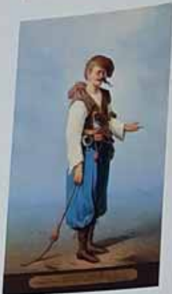
Запорозьць у XVIII ст. Котко В. Хімія з акварелі французького художника В. Шарбона. I половина XIX ст. Назва: "УПАДА ЗАПОРІЗЬКА АЗОРКА У XVIII ВІСІ". Повторення: 30 x 42 см. ДПР, № 4252420, 3-525.