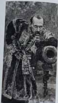
Козацький старшина. Гравюра з картини І. Ю. Рєпіна. XIX ст. (Гравюра В. В. Тарновського). Рисунки: "Зоря" - Львів, 1894. Повторення: 30 x 42 см. ДПР, № 4252420, 3-525.