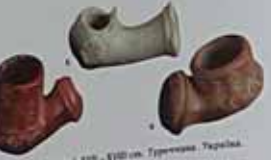
Амальові "шкереги" XVII - XVIII ст. Туреччина, Україна. Значення на 0-000 грн. м. Дніпропетровська, на території колишньої Гетьманщини.