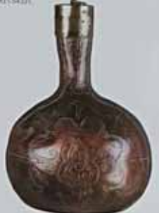
Бондара. XVIII ст. Схід. Схід, мідь, покриття, аплікація, вишарпана, аплікація. Н: 22 см, D: 11 см. ДП. П/В-476, К/1-5421.