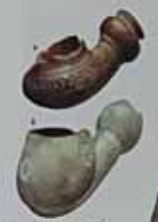
Амальові "шкереги" XVII ст. Україна. Значення на 0-000 грн. м. Дніпропетровська, на території колишньої Гетьманщини.