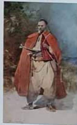
Зауважливий запорозьць. С. І. Васильківський (1854 - 1917). 1890 - 1900-4 рр. Папір, акварель: 26,2 x 15,1 см. СОХР, № Г. 949.