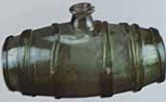
Барелет. XVIII ст. Україна. Глиня, фарфоровий на гірському вапні, вишарпаний, аплікація. Н: 13,5 см, L: 23 см. ДП. П/В-476, К/1-5421.