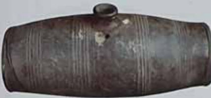
Барелет. XVIII ст. Україна. Глиня, фарфоровий на гірському вапні, аплікація, вишарпана, аплікація. Н: 12,5 см, L: 23,3 см. ДП. П/В-476, К/1-5421.