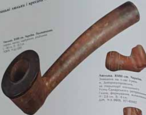
Амаль. XVII ст. Україна. Значення на 0-000 грн. м. Дніпропетровська, на території колишньої Гетьманщини.