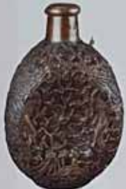
Бондара. XVII - XVIII ст. Схід. Схід, мідь, покриття, аплікація, вишарпана, аплікація. Н: 22 см, D: 11 см. ДП. П/В-476, К/1-5421.