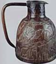
Гончак. XVII - XVIII ст. Мідь, покриття, аплікація, вишарпана, аплікація. Н: 28 см, D: 18 см. ДП. П/В-476, К/1-5421.