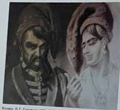
Котко В. Хімія з акварелі французького художника В. Шарбона. I половина XIX ст. Назва: "УПАДА ЗАПОРІЗЬКА АЗОРКА У XVIII ВІСІ". Повторення: 30 x 42 см. ДПР, № 4252420, 3-525.