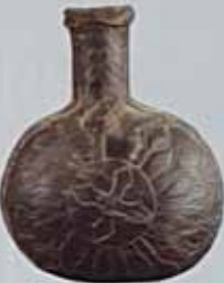
Бондара. XVIII ст. Схід. Схід, мідь, покриття, аплікація, вишарпана, аплікація. Н: 22 см, D: 11 см. ДП. П/В-476, К/1-5421.