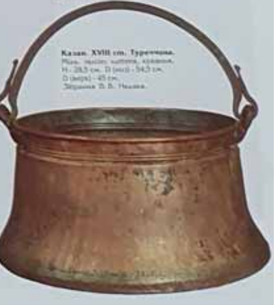
Казан. XVIII ст. Туреччина. Мідь, покриття, аплікація, вишарпана, аплікація. Н: 28,5 см, D: 18 см. ДП. П/В-476, К/1-5421.