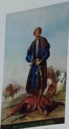
Особняк запорозьких козаків у XVIII ст. Котко В. Хімія з акварелі французького художника В. Шарбона. I половина XIX ст. Назва: "ОСОБНЯК ЗАПОРІЗЬКИХ КОЗАКІВ У XVIII ВІСІ". Повторення: 30 x 42 см. ДПР, № 4252420, 3-525.