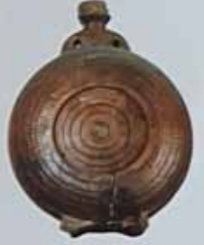
Бондара. XVIII ст. Україна. Схід, мідь, покриття, аплікація, вишарпана, аплікація. Н: 22 см, D: 11 см. ДП. П/В-476, К/1-5421.