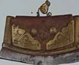
Кришка. XVIII ст. м. Кришків. Значення на 0-000 грн. м. Дніпропетровська, на території колишньої Гетьманщини.