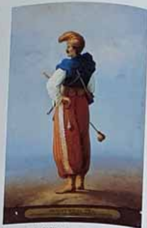
Запорозьць у XVIII ст. Котко В. Хімія з акварелі французького художника В. Шарбона. I половина XIX ст. Назва: "ЗАПОРІЗЬКИЙ КОЗАК У XVIII ВІСІ". Повторення: 30 x 42 см. ДПР, № 4252420, 3-525.