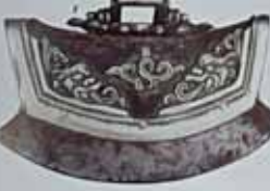
Кришка. XVIII ст. м. Кришків. Значення на 0-000 грн. м. Дніпропетровська, на території колишньої Гетьманщини.