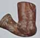
Амальові "шкереги" XVIII ст. Україна. Значення на 0-000 грн. м. Дніпропетровська, на території колишньої Гетьманщини.