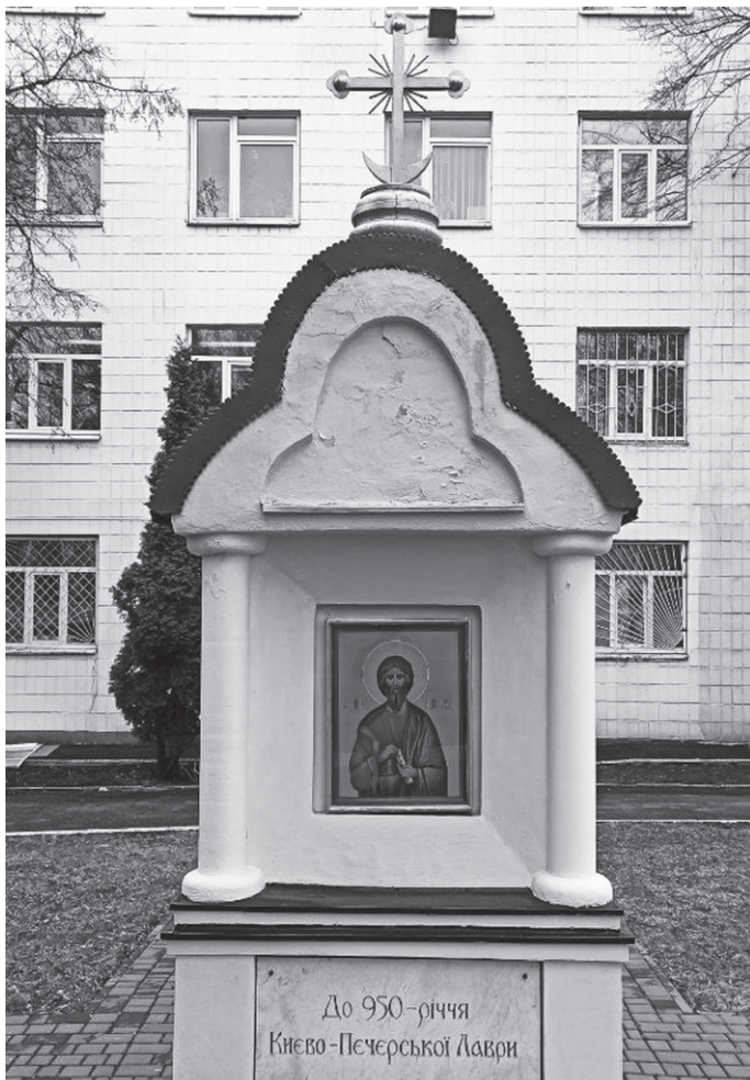
Пам'ятний знак до 950-річчя Києво-Печерської Лаври на території МАУП