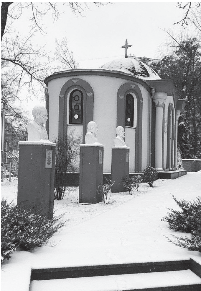
Академічна каплиця на честь Собору Дванадцяти Апостолів при МАУП