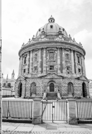
Шлях творчого інтелектуального та релігійного пошуку істини