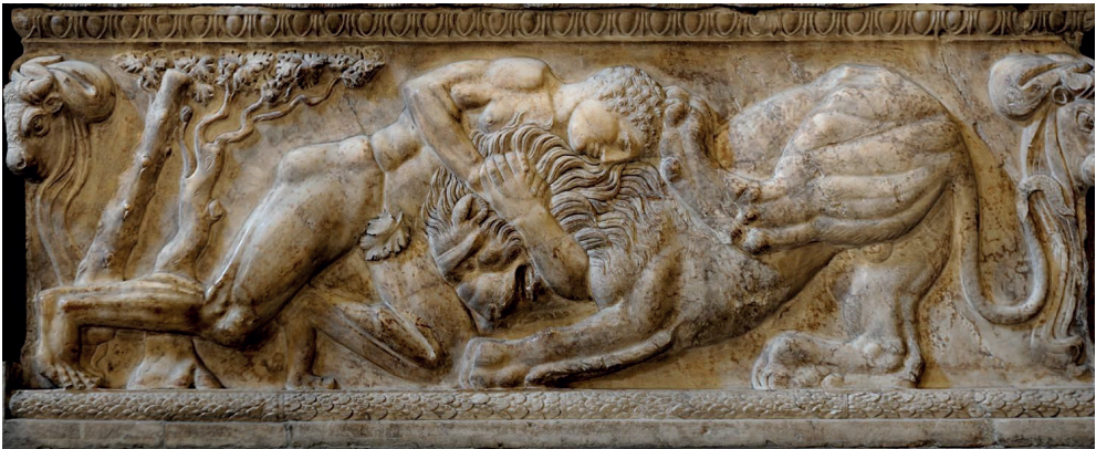
Рис. 5. Мармуровий рельєф фронтальної стінки саркофагу «Геракл убиває Немейського лева». Греція, V ст. до н. е.

У мистецтві Древньої Греції художники свідомо застосовували певні закони і правила композиції. Наприклад, використання ритму простежується у мармурових рельєфах. Людські фігури і тварини зображуються природно в простих і складних рухах. Це можна простежити на прикладі рельєфної фризної композиції із зображенням Геракла, який убиває Немейського лева (рис. 5).