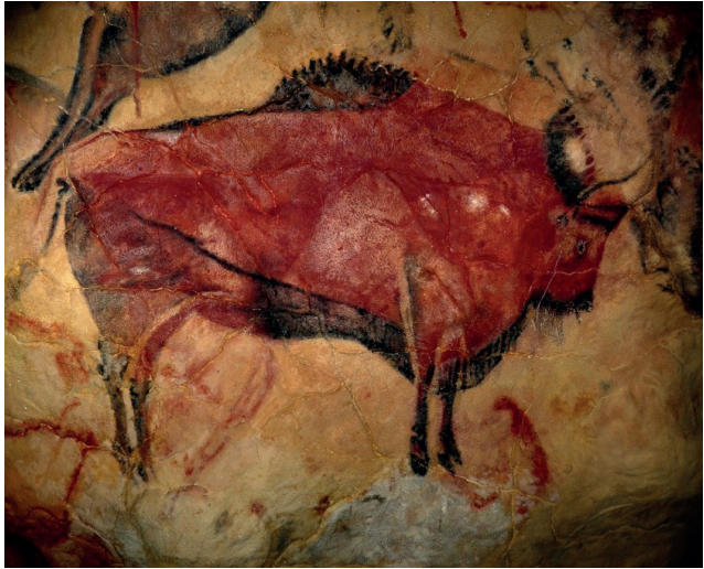
Рис. 2. Фрагмент розпису в печері Альтаміра. Іспанія, понад 10–15 тис. р. т.

Якщо у первісному мистецтві елементи зображення, як правило, розкидані, то в древньосхідних композиціях їх розташування добре впорядковане.