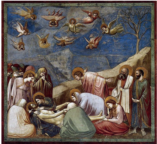
Рис. 8. Джотто ді Бондоне «Оплакування Христа». Фреска, 1304–1306 рр.

Джотто вдало використовував правила симетрії. Пізні фрески цього майстра стають більш просторовими. Тривимірність об'ємних форм, зокрема архітектурних, ритмічність у чергуванні горизонталей і вертикалей, гранична узагальненість засобів виразності створювали цілісний живописно-пластичний образ. Художник сміливо додає до монументального живопису елемент контрастного протиставлення персонажів. «Поцілунок Іуди» (рис. 8) – психологічне зіткнення піднесеного благородства і низької підступності. Саме цим прийомом пізніше скористався Леонардо да Вінчі.