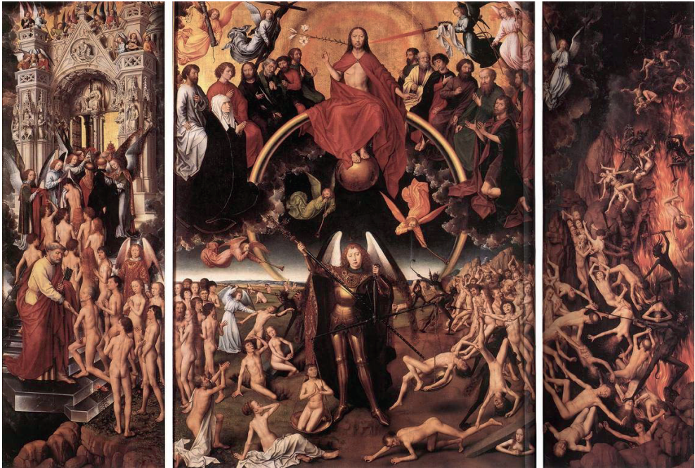
Рис. 7. Ганс Мемлінг «Страшний Суд». Нідерланди, бл. 1461–1473 рр.

Середньовічне мистецтво в усіх його виявах відмовляється від тривимірної композиції, від угруповання фігур людей. Очевидно, відмова від відображення глибини простору, активного руху, життєвості й об'ємності людини пов'язана з особливостями суспільно-економічної формації, головною роллю церковної думки, що виступала проти піднесення тілесної краси. Жорстокі релігійні догми забороняли зображувати людину, яка мала повноцінне щасливе життя. Це було властиво художникам того часу. Фігури на полотнах втрачають тілесність, зображуються поза реальним середовищем – на абстрактному тлі, немовби в потойбічному світі. Прикладом цього слугує триптих Ганса Мемлінга «Страшний Суд» (рис. 7), у якому за симетричним принципом зображено сцену за мотивами біблійних текстів, у тому числі й Апокаліпсису.