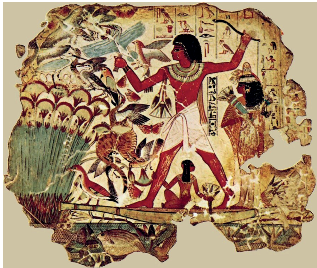
Рис. 4. Фрагмент розпису «Полювання на Нілі». Гробниця Небамуна у Фівах, біля 1400 р. до н. е.

Згідно із висновками вчених, у композиційній системі давньоєгипетського мистецтва панував канон площинного рішення. Установлено, що єгипетські художники добре знали закони фронтальної розгортки. Проте їхні малюнки не мали тривимірності, не відтворювати явищ перспективи і світлотіні. Вони суто лінійні, площинні чи комбіновані (рис. 4).