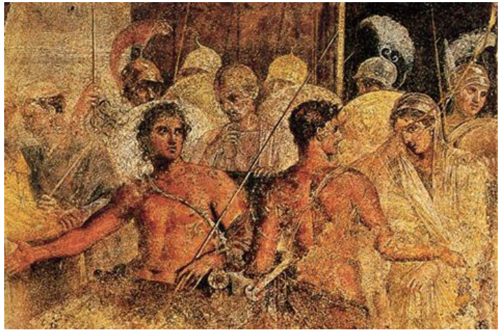
Рис. 6. Фрагмент фрески «Брісеїду забирають від Ахілла». Помпеї, I ст. н. е.

У живопису Стародавньої Греції трапляються твори з чітко вираженим композиційно-сюжетним центром. Приклад тому – помпейська фреска «Брісеїду забирають Від Ахілла» (рис. 6). Головними є дві фігури воїнів, що яскравими плямами розташовані в центрі композиції. Динаміка міфологічної сцени розгортається на тлі взаємодіючих учасників події, що вказують на чітку ритмічну організацію композиції.