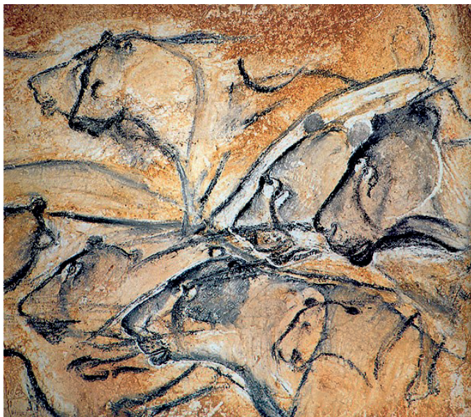
Рис. 1. Фрагмент розпису в печері Шова. Франція, понад 30–33 тис. р. т.

У людини відчуття єдності елементів як основи цілісної організації композиції виникло ще за прадавніх часів. Про це свідчать численні, іноді хаотично, але частіше впорядковані зображення тварин на стінах печер (рис. 1, 2).