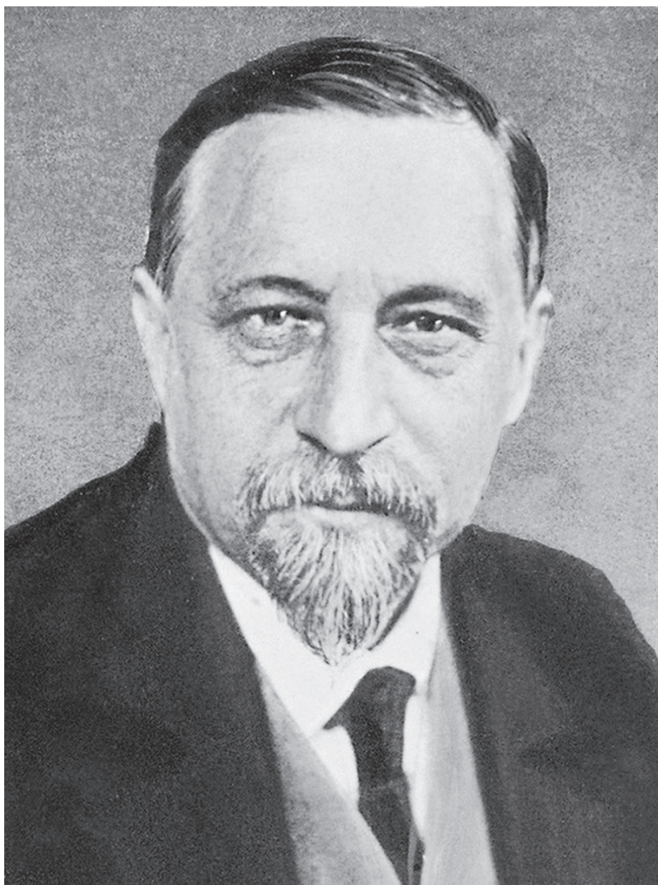
Карташов Антон Владимирович (1875–1960)