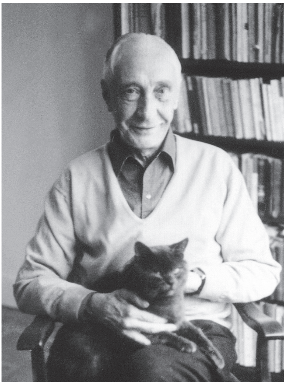
Євдокимов Павло Миколайович (1901–1970)