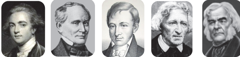
W. Jones F. Bopp R. Rask J. Grimm Vostokov A.C.