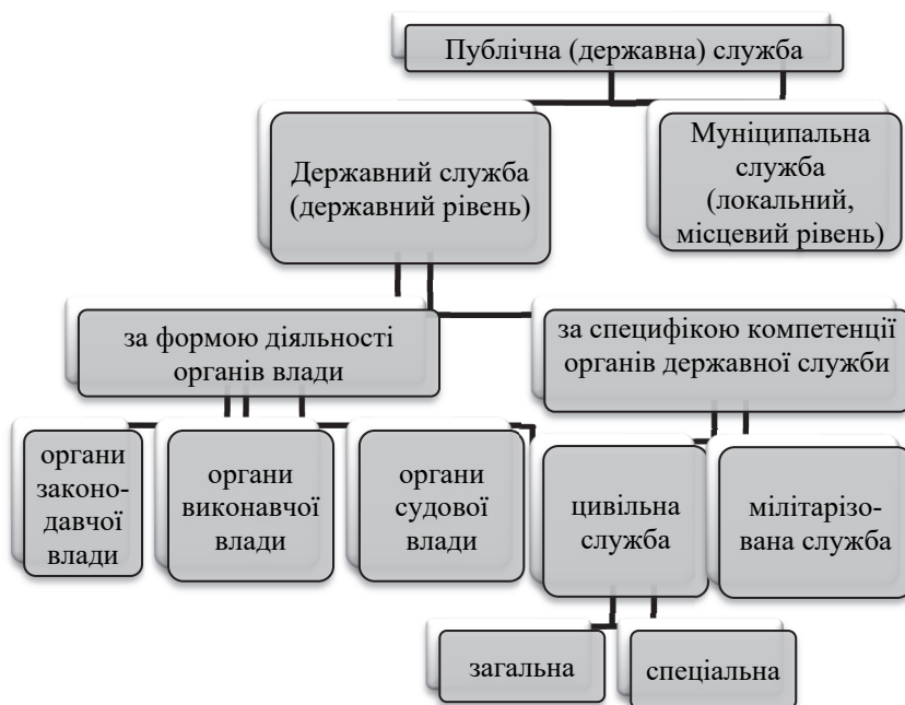
Рис.1.3. Публічна служба та її види

Виокремлюють наступні види публічної (державної) служби: службу в органах законодавчої, виконавчої та судової влади; цивільну та мілітаризовану (воєнну) службу; цивільну (в органах законодавчої, виконавчої влади) та спеціалізовану (військову, дипломатичну, митну, в правоохоронних органах та ін.) (рис. 1.3.)