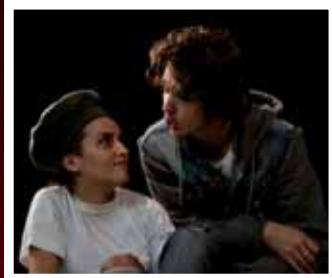
Я. Гловацький «Замазурка» Батько — І. Жаровна, Режисер — І. Слободський.