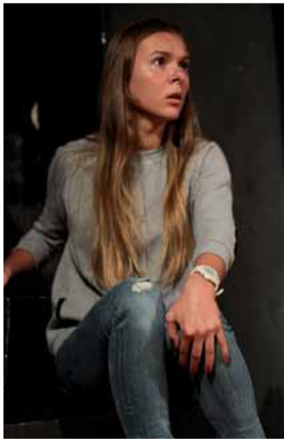
Р. Тома «Вісім кохаючих жінок» Сюзон — К. Левищенко.

...обману та вірі підда- ється тільки мисленева частина обманщика, але не пам'ять... ст. 20.