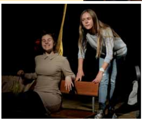
С. Стратієв «Автобус» Сцена з вистави.