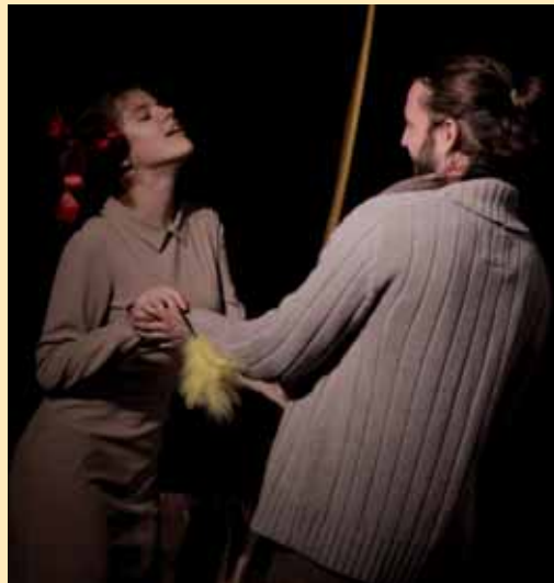
Р. Тома «Вісім кохаючих жінок» Сцена з вистави.

...рух є тим запальником, внаслідок якого запускається механізм переживання актора в публічних умовах творчості. Насамперед відтворюється та виконується рух, а після з'являється відповідний стан, думка, переживання... ст. 96.