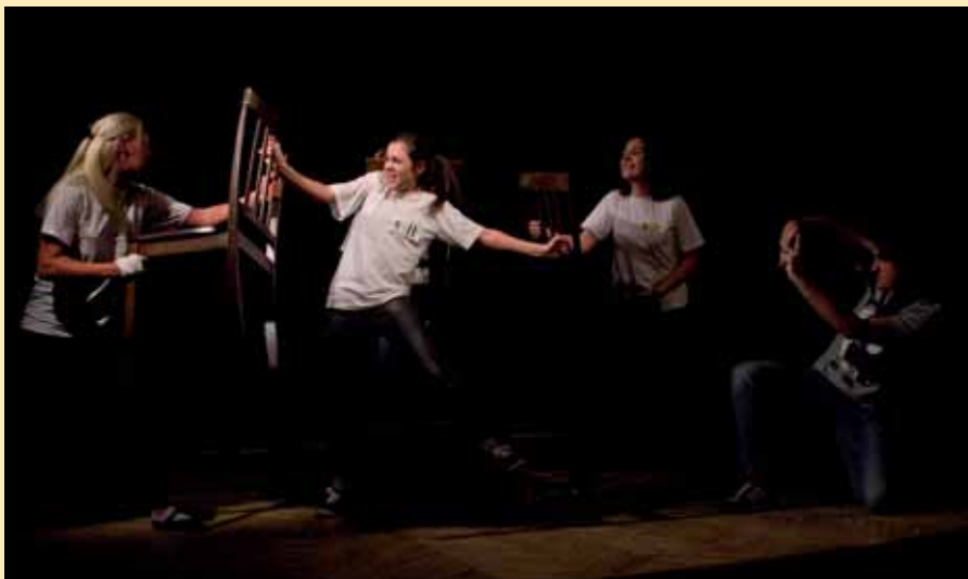
Я. Гловацький «Замазурка» Сцена з вистави.