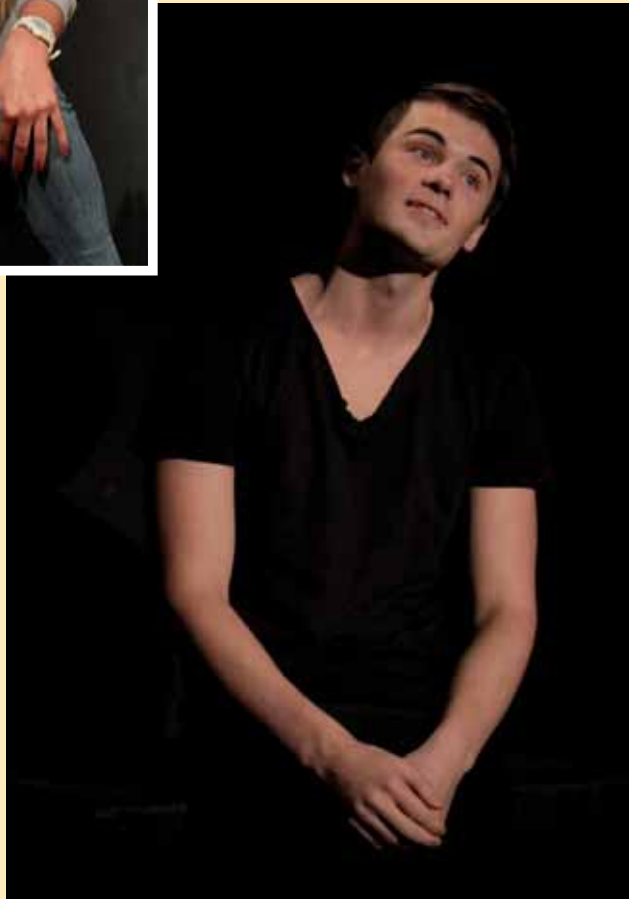
В. Шекспір «Гамлет» Гамлет — А. Фіголь.

...обману та вірі підда- ється тільки мисленева частина обманщика, але не пам'ять... ст. 20.