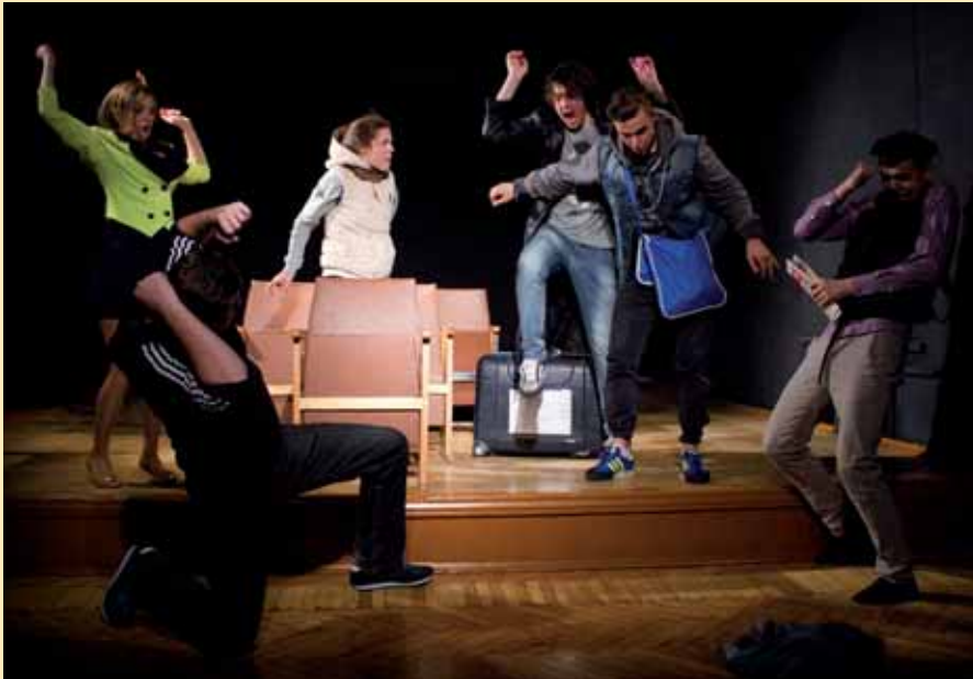
С. Стратієв «Автобус» Сцена з вистави.

...рух є тим запальником, внаслідок якого запускається механізм переживання актора в публічних умовах творчості. Насамперед відтворюється та виконується рух, а після з'являється відповідний стан, думка, переживання... ст. 96.