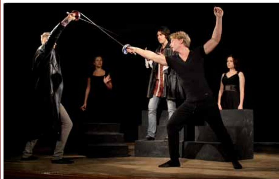
«Гамлет» Сцена з вистави.

...акторський рух служить засобом для імітації рухів персонажа, що означають його дії... ст. 87.