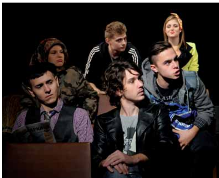
С. Стратієв «Автобус» Сцена з вистави.

...обман у контексті акторської майстерності означає вчинити так, щоб оточуючі не побачили акту відтворення рухів, що означають дії, поведінку та характерні риси персонажа. Самообман — це обман власної свідомості. Без обману оточення, публіки самообман неможливий... ст. 97.